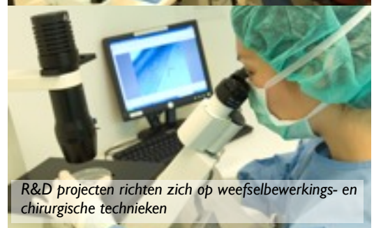
R&D projecten richten zich op weefselbewerkings- en chirurgische technieken