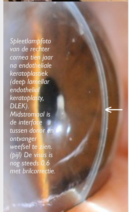
Spleetlampfoto van de rechter cornea tien jaar na endotheliale keratoplastiek (diep lamellar endothelial keratoplasty, DLEK). Midstromaal is de interface tussen donor en ontvanger weefsel te zien. (pijl) De visus is nog steeds 0.6 met brilcorrectie.