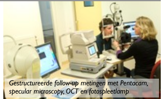
Gestructureerde follow-up metingen met Pentacam, specular microscopy, OCT en fotospleetlamp

Ham L, Dapena I, van Luijk C, van der Wees J, Melles GRJ. Descemet membrane endothelial keratoplasty (DMEK) for Fuchs endothelial dystrophy: review of the first 50 consecutive cases. Eye. 2009;23:1990-8.