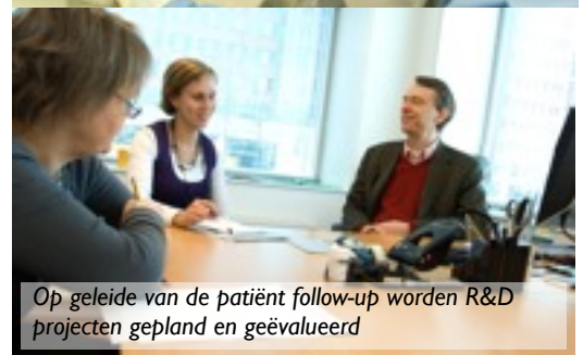
Op geleide van de patiënt follow-up worden R&D projecten gepland en geëvalueerd