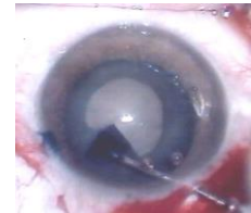
Dye enhanced surgery