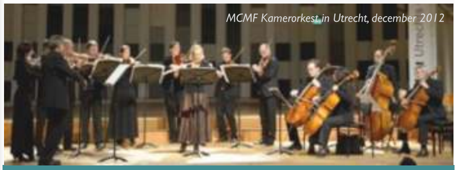
MCMF Kamerorkest in Utrecht, december 2012