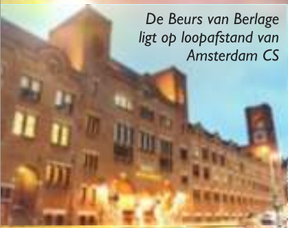
De Beurs van Berlage ligt op loopafstand van Amsterdam CS